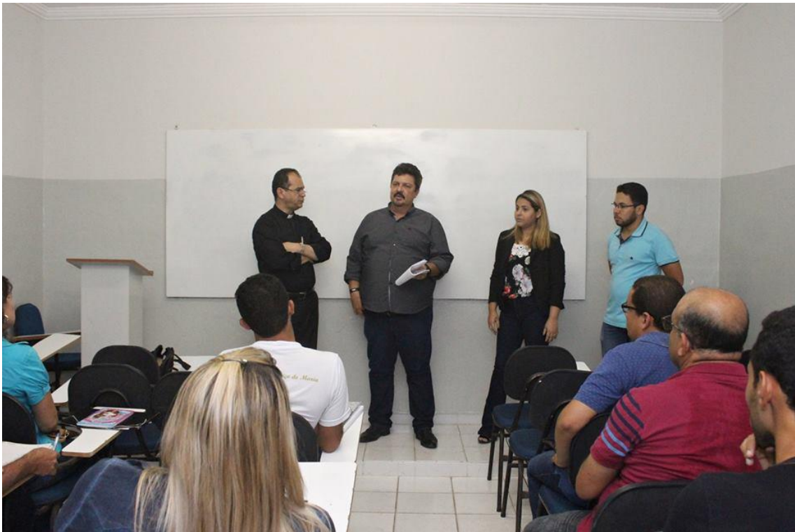
Dia do estudante é celebrado com missa na FACOL.